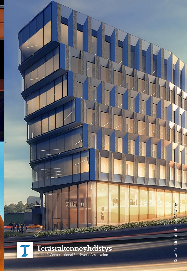
Kuva: Arkkitehtitoimisto SARCO Oy